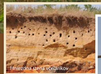
Hniezdna stena včelárikov