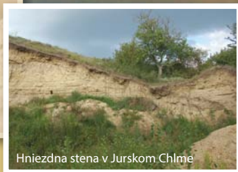
Hniezdna stena v Jurskom Chlme